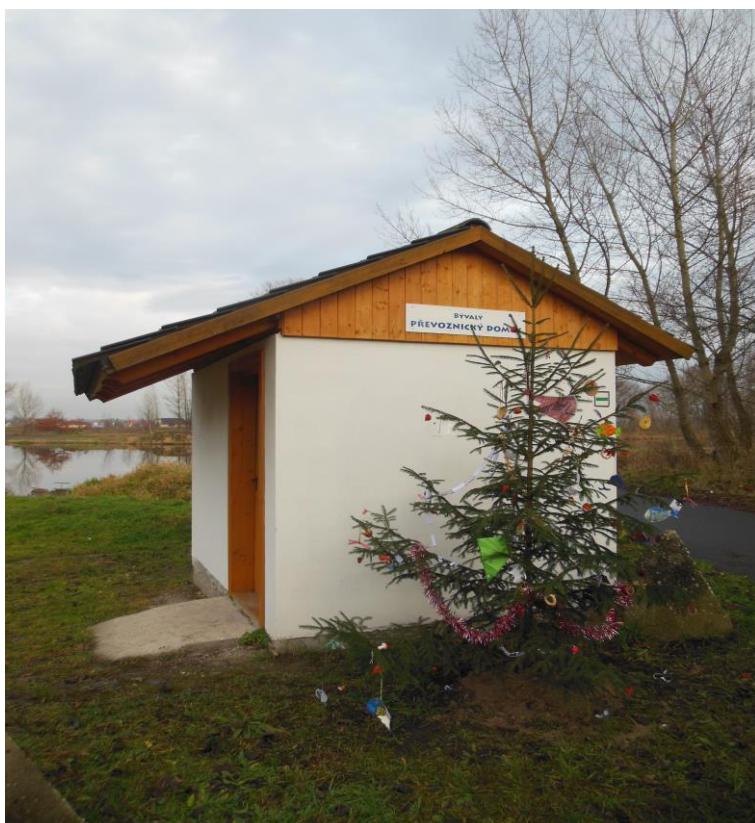
Alena Štemberová, baráčníci

Další pozvání pro děti je na předvánoční procházku k Labi. U bývalého přívozu od 7. prosince stojí neozdobený stromek, na který můžete navěsit ozdoby, nejlépe ve tvaru ryby a lodičky. Přívozník z domku vám v příštím Zpravodaji poděkuje a ocení dobré nápady a výtvarné provedení ozdob.