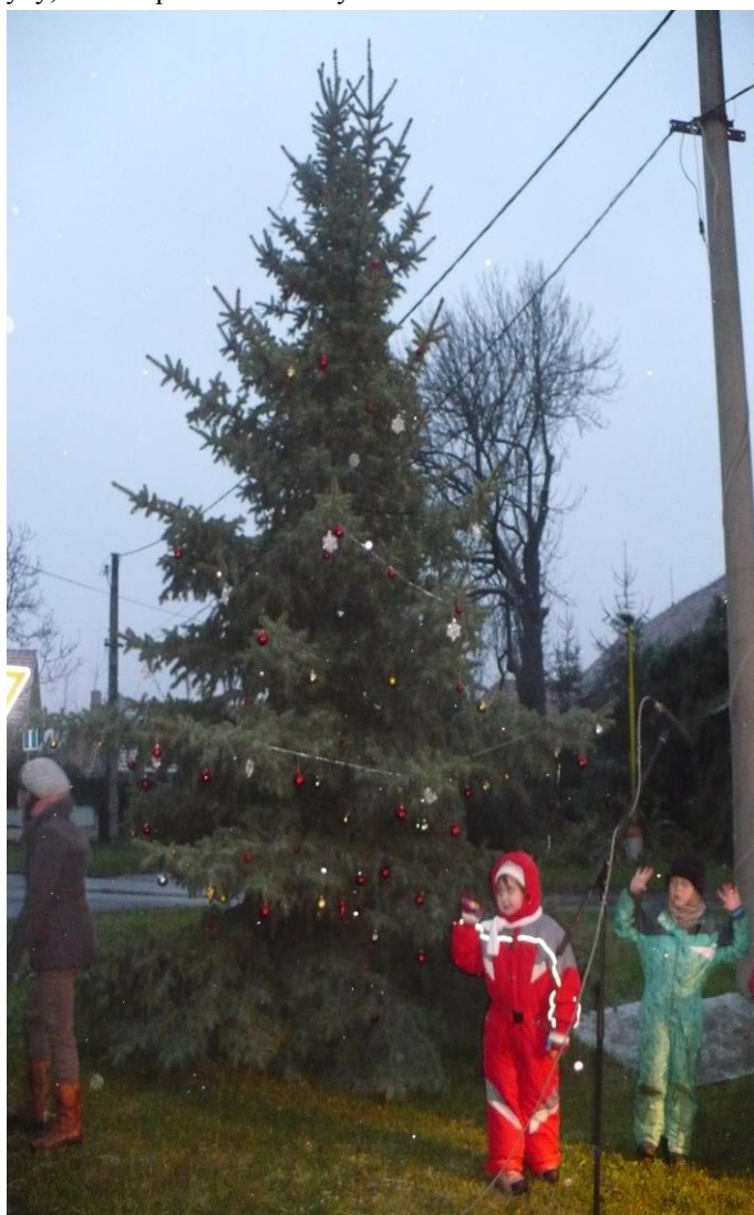
Akce dětí u vánočního stromku