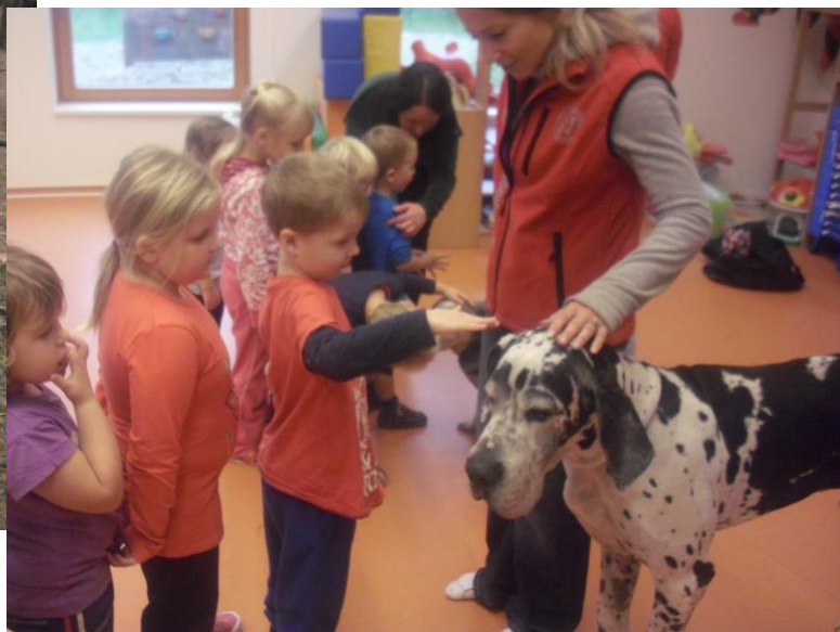
Fota z některých jmenovaných akcí