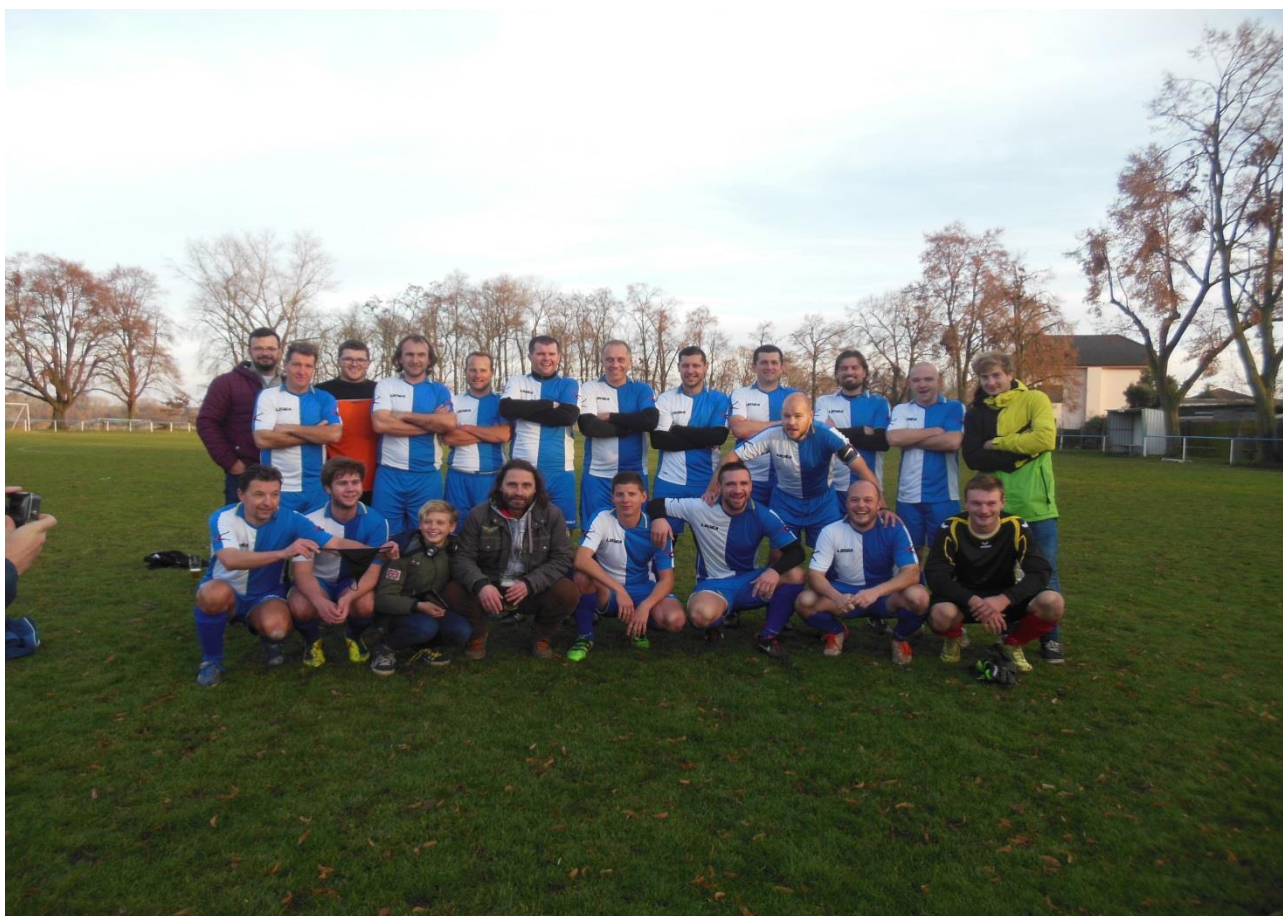
Vítěz podzimní části III.třídy okresu Mělník mužstvo Záryby „B“